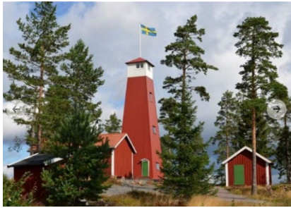
Rösåsens utsiktstorn | Visit Dalarna

Följ med redan nu på söndag till Rösåsens utsiktstorn och grilla med oss! Föreningen står för grillkolen så ta med dig det du vill ha att äta och dricka. Grillen tänds klockan 14 och vi ses då vid parkeringen. Alla är välkomna men anmäl så vi vet hur många som kommer.