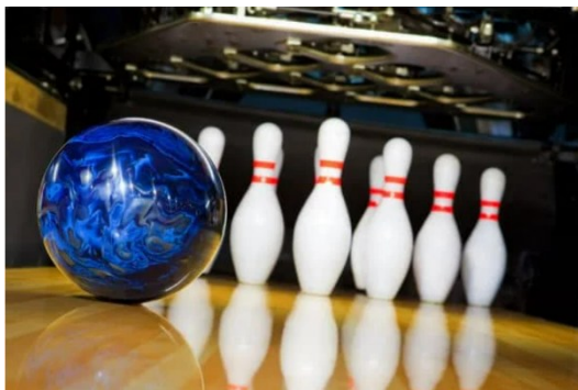
Bowling - Maserhallen

Välkommen på bowling i Maserhallen den klockan 10-11 den 2 februari .