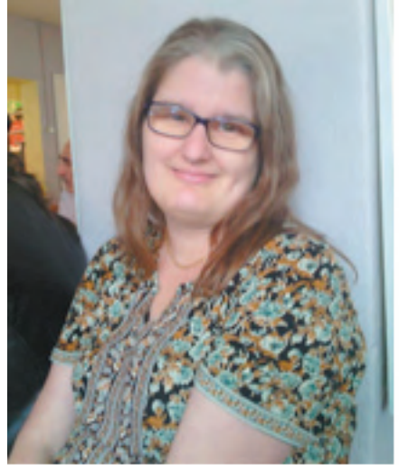
TEXT OCH FOTO: LINDA MATHIASSON

Frågor som intresserar mig i det här är arbetsmarknad och vidare studier för personer med diagnos. Jag vill även försöka lyfta svårigheten för kvinnor/flickor med diagnos att behandlas likvärdigt.