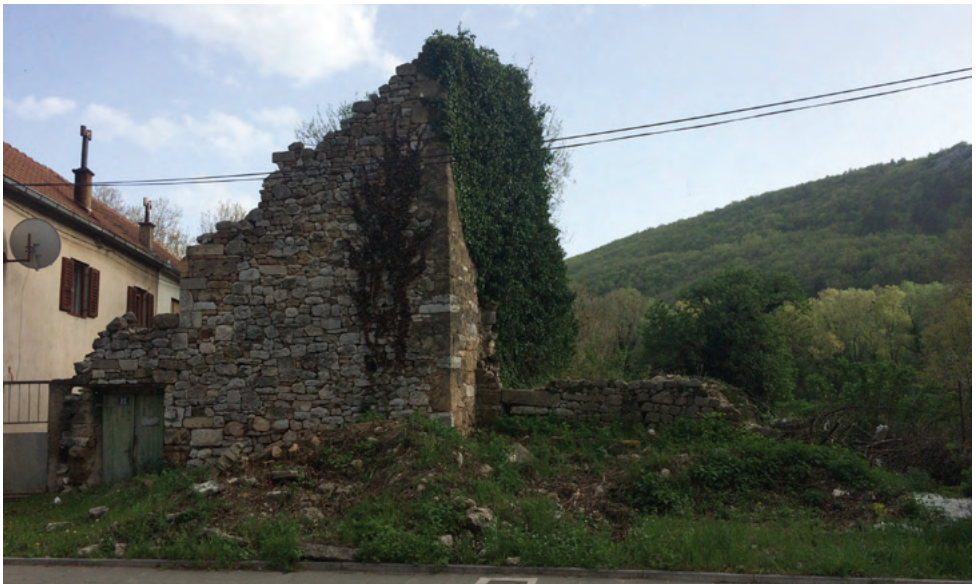
Bild: Farfars husruin på Zvonimirova 91 i Knin, Tyvärr finns det inga bilder på någon av hundarna, men ruinen står fortfarande kvar.