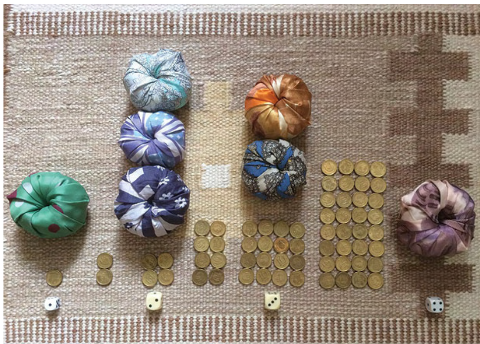
Andelen människor på de fyra inkomstnivåerna

”På nivå 2 har din mamma råd med några hönor, vilket betyder ägg. Och en cykel. Samt plastdunkar så att du och dina syskon bara behöver en halvtimme om dagen för att hämta vatten. Och nu har din mamma en gasspis så att du och dina syskon slipper samla ved, och därmed kan gå i skolan. Och läxorna kan du läsa i glödlampans sken de kvällar ni har ström.