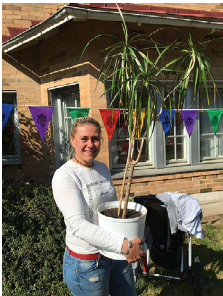
Besökare med ny krukväxt