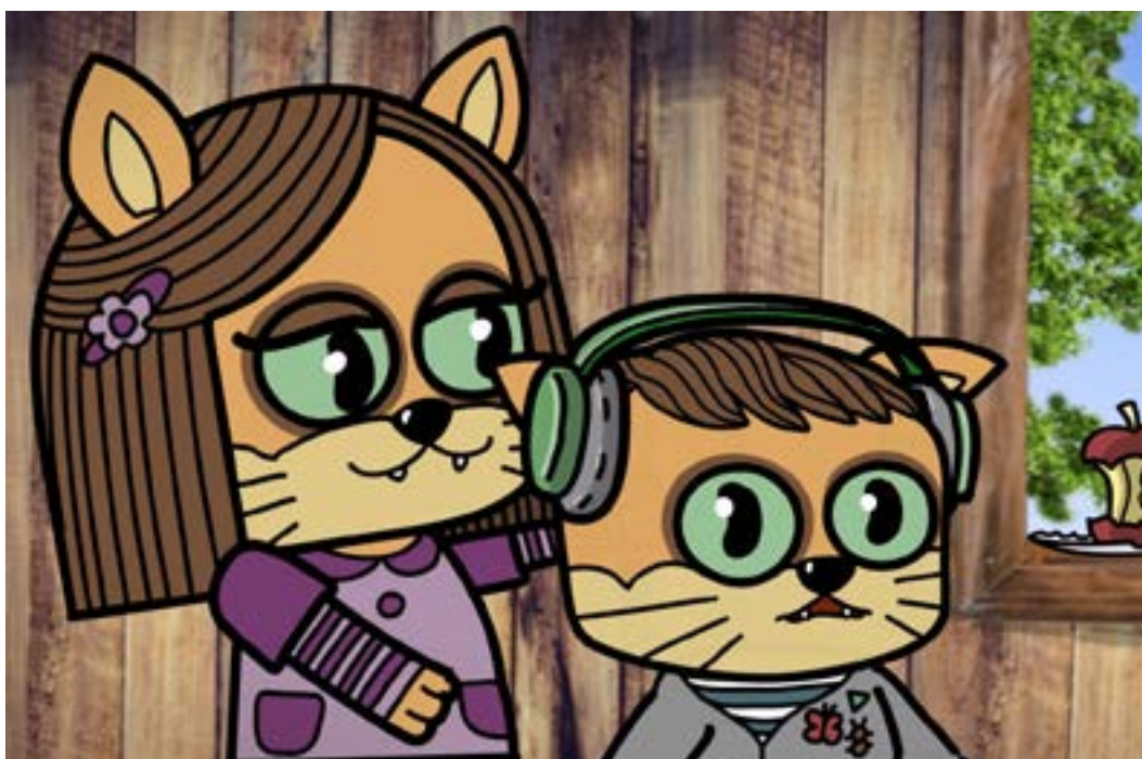
Bild från den tecknade kortfilmen Mik producerad för Autism- och Aspergerförbundet. Filmens huvudperson Mik har autism. Det sägs inte i filmen att det är så, men vi känner igen flera tecken på det.

Förbundet vill även tacka alla privatpersoner, företag och organisationer som genom gåvor och testamenten skänkt pengar till Autism- och Aspergerförbundet.