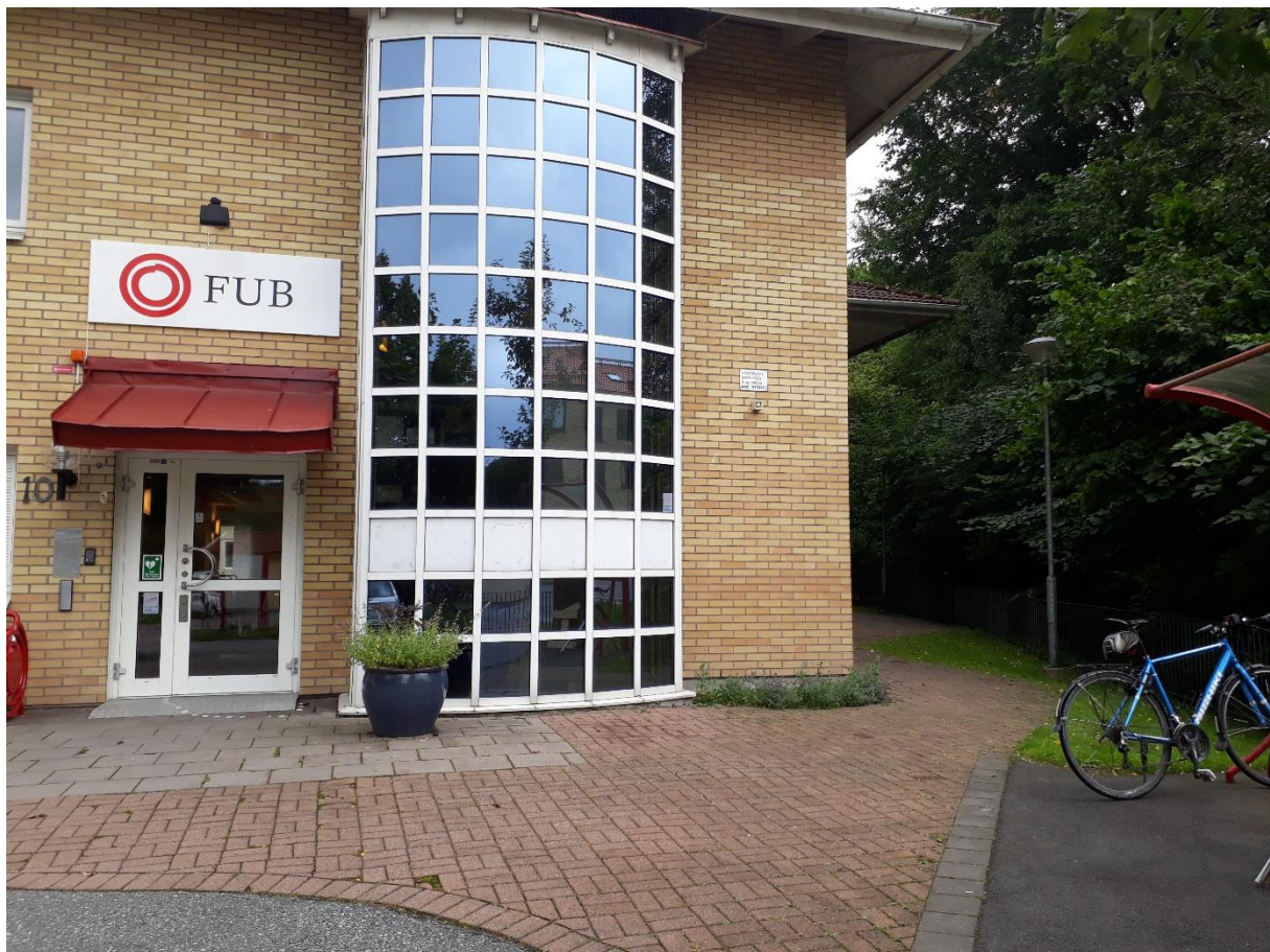
Huvuding ng. G   t h ger runt knuten.